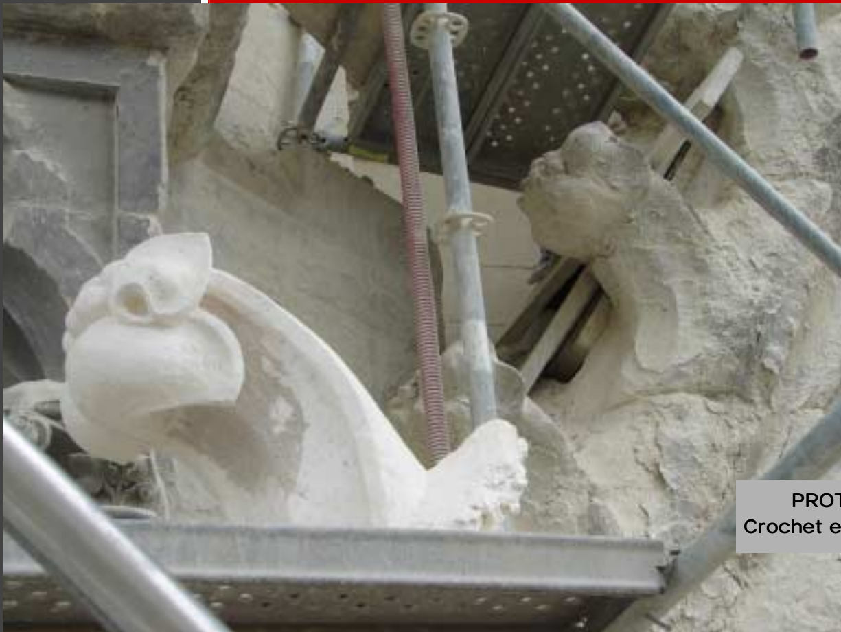
PROTOTYPE : Crochet et essai in situ