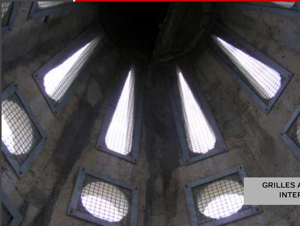
GRILLES ANTI PIGEON INTERIEURES